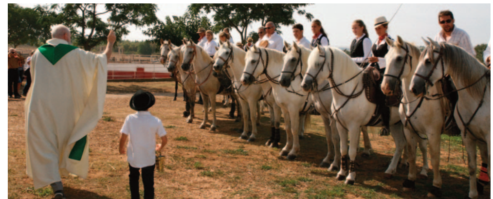
Journée à l'ancienne