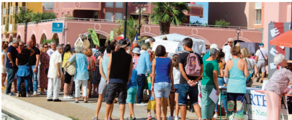
Farandole des associations